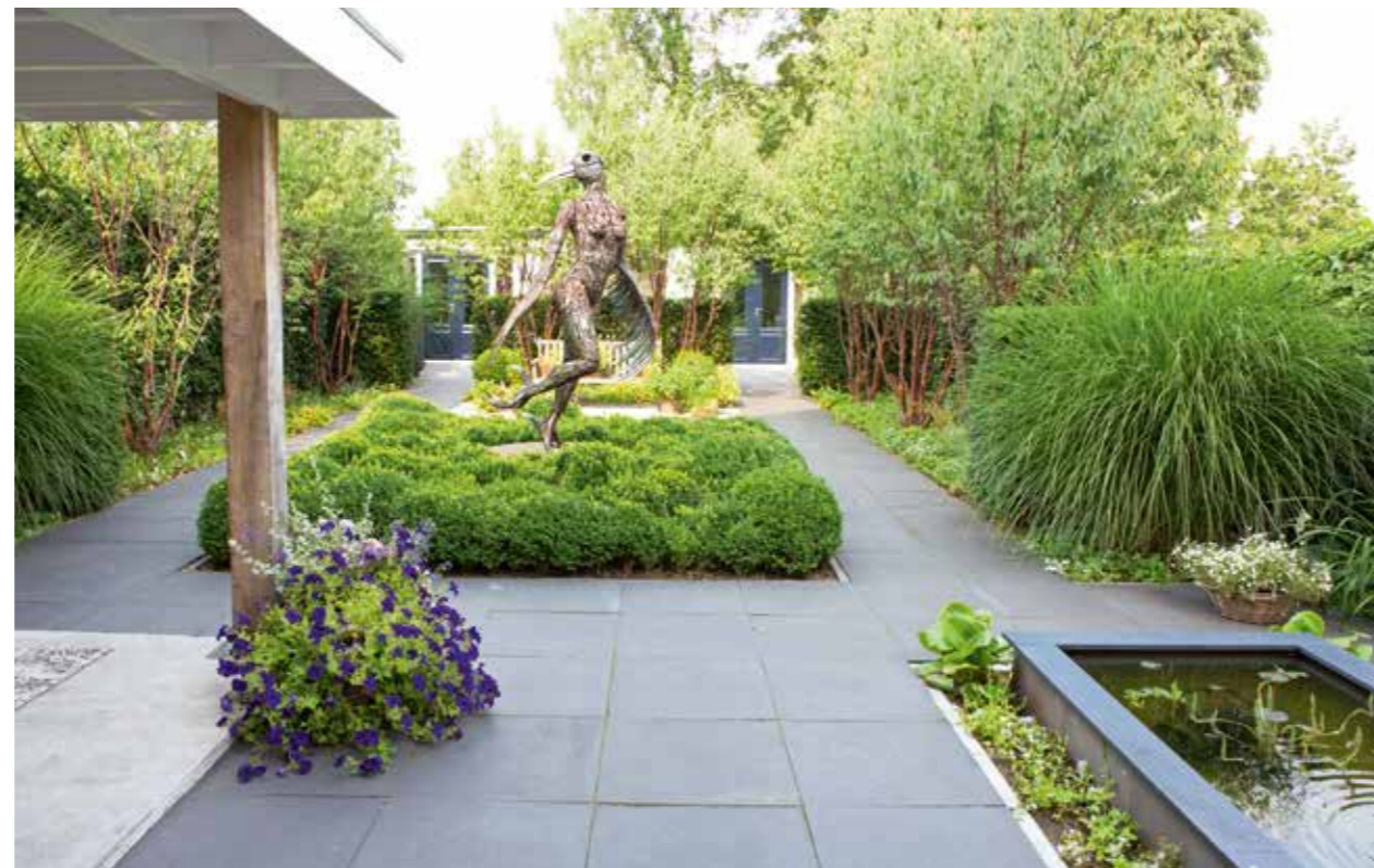
Vanuit de woonkamer kijk je over de verhoogde vijver en over de twee paden naar het achterste terras. Het ruim 2 meter hoge beeld van Arild Veld staat centraal in het ontwerp. Achter de Taxus -haag is een aparte tuinkamer met loggia en twee bergruimtes.