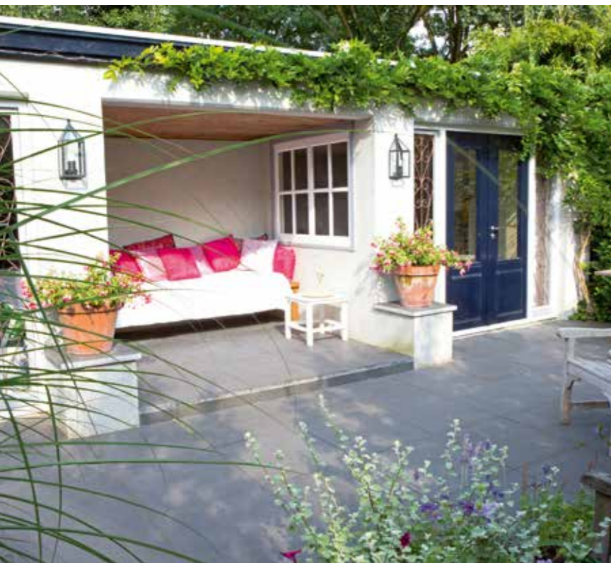
Helemaal achter in de tuin, verscholen achter de Taxus -haag, vind je de beschutte loggia. Hier zit je helemaal uit het zicht. Oorspronkelijk stonden hier drie garageboxen, door de middelste box open te maken is er een bijzonder geheel ontstaan. De loggia lijkt royaler door de twee lage muurtjes en de verhoogde bestrating. Links en rechts zijn bergruimtes gemaakt.