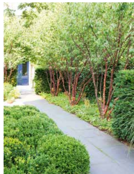
Een rij van drie Prunus serrula flankeert het tuinpad. De meerstammige bomen worden van onderen aangelicht voor een sprookjesachtig effect. Onder de Prunus groeit Geranium x cantabrigiense 'Biokovo' , Persicaria affinis en Astilbe , vooraan Miscanthus sinsensis 'Gracillimus' .