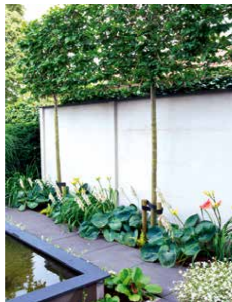
Op de grens met de buurtuin zorgt een wit gestuikte muur voor privacy. De bovenzijde is afgewerkt met hardsteen. In de strook voor de muur groeien leibomen van haagbeuk, ze sluiten aan op de muur en voorkomen zo inkijk op het terras. Eronder een combinatie van Hosta 'Elegans' en Hemerocallis 'Pink Damast' .