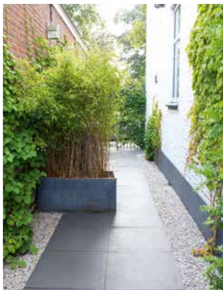
De stijl van het ontwerp is doorgetrokken in de zijtuin. Door de randen van grind ligt het pad los van de muren en lijkt de ruimte groter. Een verhoogde bak van hardsteen breekt het lange pad, een met klimop begroeid antiek smeedijzer hek voorkomt inkijk naar de achtertuin. In de bak groeit Fargesia rufa .

muur. Het tweede afdak heeft de hoogte van de lage muur en is iets onder het hogere deel geschoven. Door het afdak aan te laten sluiten met de muur wordt geluidsoverlast bovendien voorkomen. De daken steunen op eikenhouten balken van 20 bij 20 cm die op een metalen voet zijn geplaatst. Bovenop de houten platen ligt bitumen, tegen de gevel van de woning is een loodslab gemaakt. „Het lage afdak is gezelliger om onder te zitten, daarom staat hier de eettafel”, zegt De Weijer. „Omdat er licht tussen de twee daken doorkomt, is het eerste deel met de buitenkeuken goed verlicht. De keukendeurtjes hebben we gemaakt van de oude vloerdelen uit de kamer.”